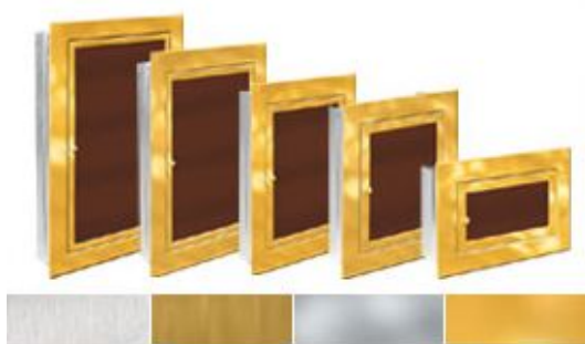
Серия 6000 - встроенные распределительные модульные щитки, с хромированным покрытием

Заказ щитов можно сделать по телефону по e-mail на странице интернет магазина