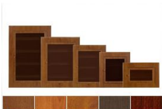
Серия 3000 - встроенные распределительные модульные щитки, с имитацией дерева

Электрические щиты выпускаются различных серий. Ключевое направление деятельности компании - электрические щиты, представленные несколькими дизайнерскими сериями: ценные породы дерева, хромированное покрытие, окраска по каталогу RAL.