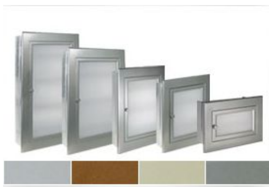
Серия 4000 - встроенные распределительные модульные щитки, под металл